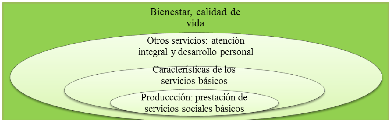
Gráfico 1. La residencia como organización

y la prestación de otros. En consecuencia, el proceso organizativo de las residencias que se ha establecido en este trabajo es el que aparece en el gráfico 1.